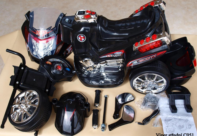
Viper střední C051