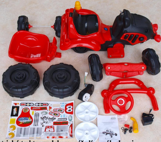
Elektrický traktor s vlekem, nářadím, nálepkami,